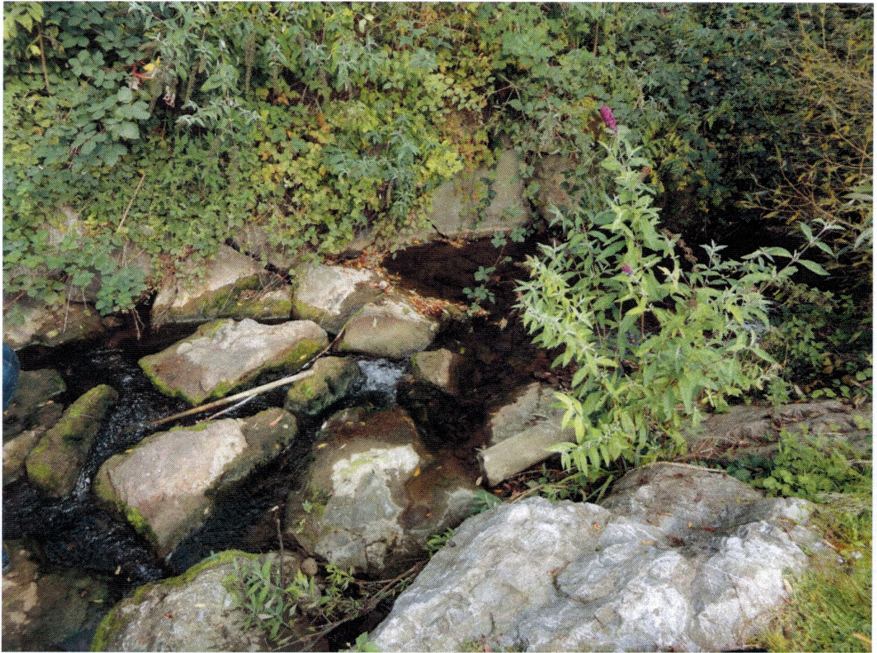
Verbauung des Mühlebaches im unteren Bereich von Grundstück Nr. 684